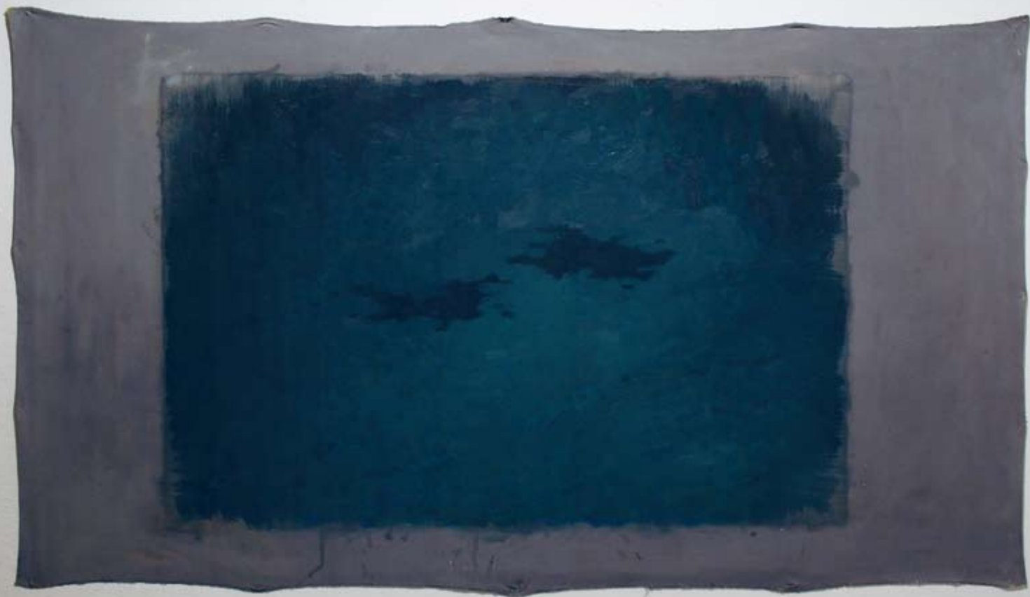
Ville Huhtanen, Himmeissä välissä (2009), öljy pingottamattomalle kankaalle, 180 x 107 cm

talismi, jokainen olemassa oleva kapitalismi, esimerkiksi järjestelmä, joka vallitsee Suomessa tai Pohjoismaissa tai Pohjois-Euroopassa ylipäätään tai jopa niinkin abstrakti kuin länsimainen kapitalismi, on riittävän konkreettinen ollakseen hyvin herkkä. Jo Marx painottaa, että kapitalismi aina itse tuottaa kriisejä, omia kriisejään, hetkiä jolloin, kapitalismi muuttaa edellytyksiään. Jo se, että kapitalismi on sisäisiä kriisejä tuottava järjestelmä, todistaa samalla väitteen, jonka mukaan kapitalismi on hauras. Kriisi on aina kriisi: se voi johtaa myös tuhoon.