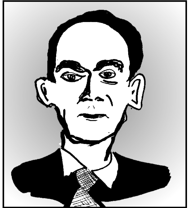
P. F. Strawson

Oxfordilaisten hyökkäykset ”mannermaista filosofiaa” vastaan olivat aggressiivisia, jopa sadistisia. Haren mukaan ”eksistentialisteissa ja muissa mannermaissa filosofeissa on vikana se, ettei heitä ole tarpeeksi muistutettu täsmällisen kielenkäytön välttämättömyydestä. Joskus epäilen, että tämä johtuu siitä, ettei heillä ole oppilaanohjausjärjestelmää”. 108 Mindin kirja-arviopalsta yritti pitää lukijat tietoisina ulkomaisten kollegojen ilveistä. Jokainen mannermaisen filosofian teos paljastui lopulta, tarkan tutkimisen jälkeen, mahtailevaksi hölynpölyksi: se saattoi sisältää hieman uskoa,