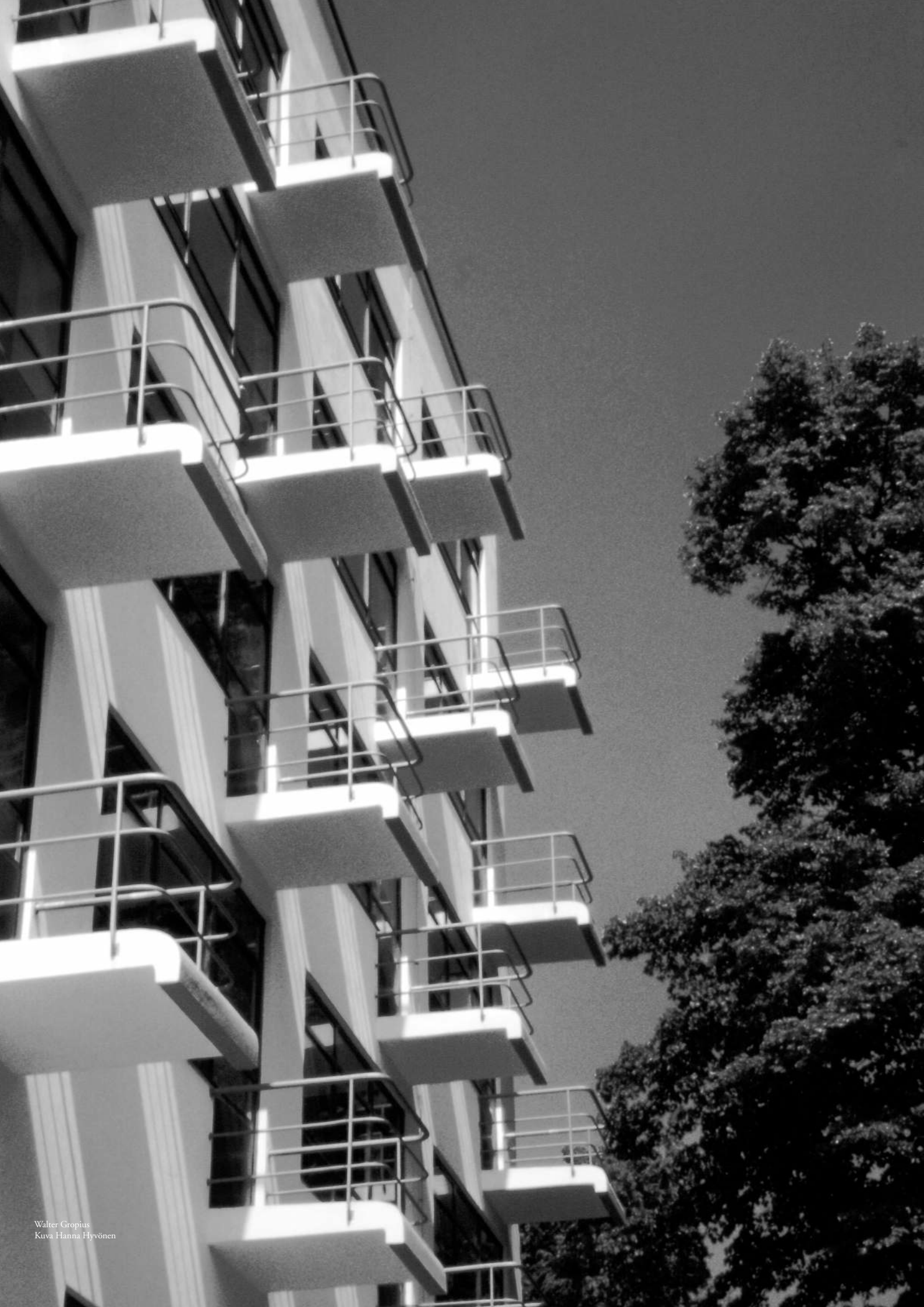
Walter Gropius