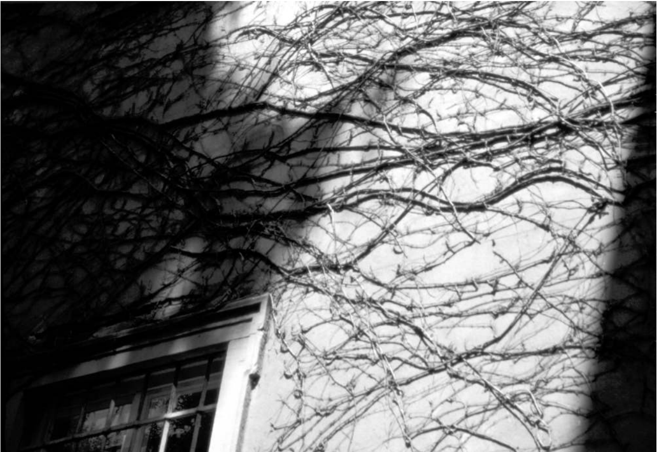
Orgaanisena ornamentti ei ole esineellä vaan esinettä. Frank Lloyd Wright.

1920-luvulla pelkistettyjen perusgeometristen muotojen katsottiin edustavan koneellisen tuotannon aikakaudelle ominaista viimeistelyä, tieteen ja teknologian ehdoilla anonyymisti valikoitunutta ja jalostunutta muotoa. Koulukirjojen kuvista tutut geometriset perusvolyymit omittiin näin rakentamisen teknisen edistyneisyyden ja rationaalisuuden takeeksi, vaikka esimerkiksi menneiden vuosisatojen sulavat holvirakenteet olivat edellyttäneet paljon hienostuneempia geometrian ja kivensahauksen tekniikoita kuin 1920-luvun arkkitehtuuri. 48 Betonielementeiksi kovin helposti myöhemmin konkretisoituneet perusgeometriset osatekijät auttoivat toki jatkossa kustannustehokkuuteen siinä kuin sopivasti valitut pakkauslaatikotkin; väitettyjä intellektuaalisia haasteita muodon geometrinen yksinkertaistaminen tarjosi lopulta vähän. Le Corbusier pyrki pelastamaan ajalle ominaisiksi väittämänsä muodot kritiikiltä ja ajan hengen muutoksilta kuvaamalla teknistä kehitystä ja kulttuurin henkistymistä pohjimmiltaan paluuna arkaaisiin totuuksiin. Funktionalististen huviloiden hohtavan valkoisen rappauksen ja teknisesti edistyksellisiksi väitettyjen muotojen sisältä paljastunutta perinteistä tiiltä ei siten ole koettu vakavana takaiskuna Le Corbusierin ohjelmalle.