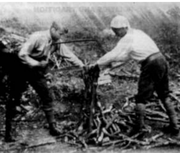
Hans-Georg Gadamer ja Martin Heidegger

näyttäytyy useilla eri tavoilla teoksen tulkintojen moneudessa. Esim. klassinen teksti tulkitaan ja ymmärretään eri aikakausina eri tavoin. Ymmärtäminen itsessään on toisinymmärtämistä ( Anders-Verstehen ). On muistettava, että ainoastaan tulkinta avaa lukijalle pääsyn tekstiin; tekstiä ei voi ymmärtää, ellei sitä tulkitse. Yksi ja sama teksti ei voi koskaan tulla näkyviin sellaisenaan, vaan ainoastaan erilaisissa tulkinnoissa; ei kuitenkaan ole olemassa yhtä ainoaa oikeaa tulkintaa eikä myöskään kaikenkattavaa, kaikki näkökulmat itseensä sisällyttävää kokonaistulkintaa. “Olla yksi ja sama ja kuitenkin toinen, tämä paradoksi, joka pätee jokaisen perinnesisällön kohdalla,” 19 havainnollistaa osuvasti Gadamerin