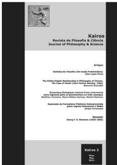
Kairos vuosimallia 2011